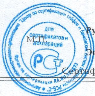
Схема сертификации - 1